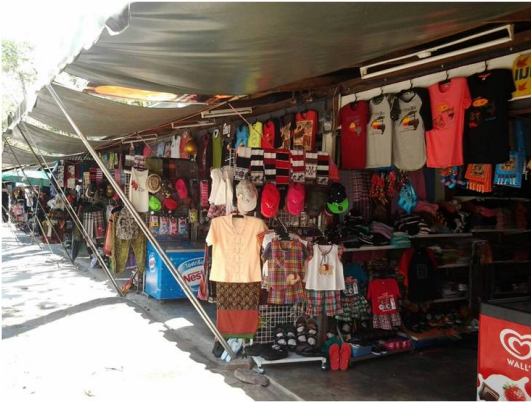
ศูนย์บริการนักท่องเที่ยวศรีฐาน (เชิงเขา)