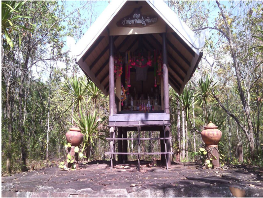
ศาลเจ้าพ่อพานแก้ว ภูหินกอง