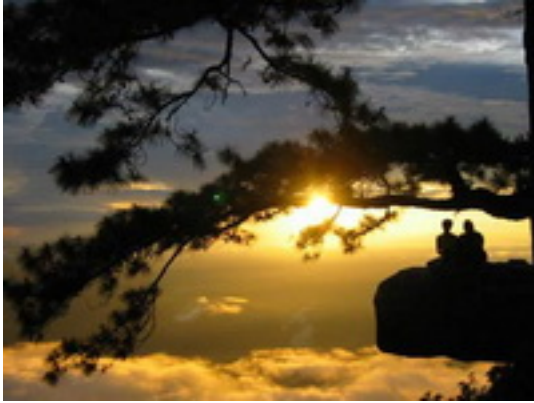
ภาพหล่มสัก อุทยานแห่งชาติภูกระดึง